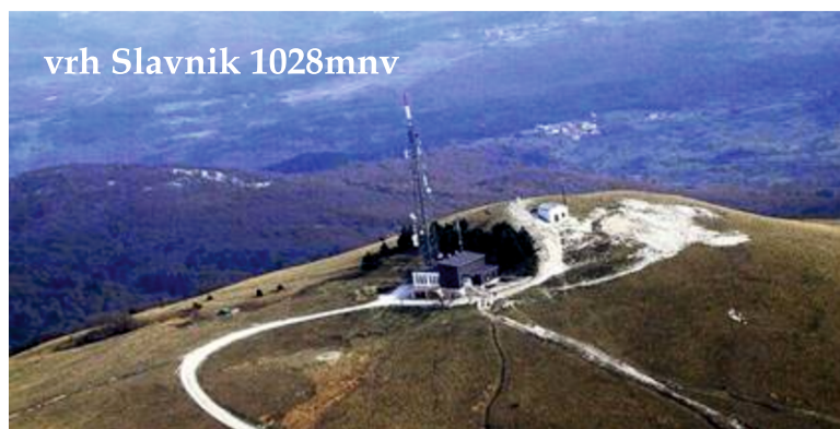
vrh Slavnik 1028mnnv